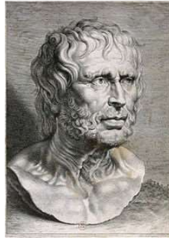
Seneca 1 - 65 n. Chr.