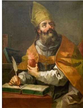
Augustinus 354 - 430 n. Chr.

factus eram ipse mihi magna questio et interrogabam animam meam, quare tristis esset et quare conturbaret me valde, et nihil noverat respondere mihi. Et si dicebam: „spera in deum“, iuste non obtemperabat, quia verior erat et melior homo, quem carissimum amiserat, quam phantasma, in quod sperare iubebatur.