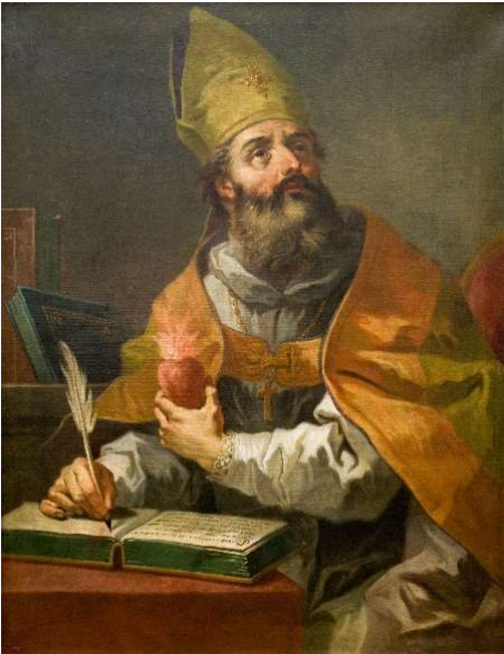
Augustinus 354 - 430 n. Chr.

Sed hoc pacto, si quis tam minutum cerneret, ut in vermiculato pavimento nihil ultra unius tessellae modulum acies eius valeret ambire, vituperaret artificem velut ordinationis et compositionis ignarum eo, quod varietatem lapillorum perturbatam putaret, a quo illa emblemata in unius pulchritudinis faciem congruentia simul cerni conlustrarique non possent. Nihil enim aliud minus eruditis hominibus accidit, qui universam rerum coaptationem atque concentum inbecilla mente conplecti et considerare non valentes, si quid eos offenderit, quia suae cogitationi magnum est, magnam rebus putant inharere foeditatem.